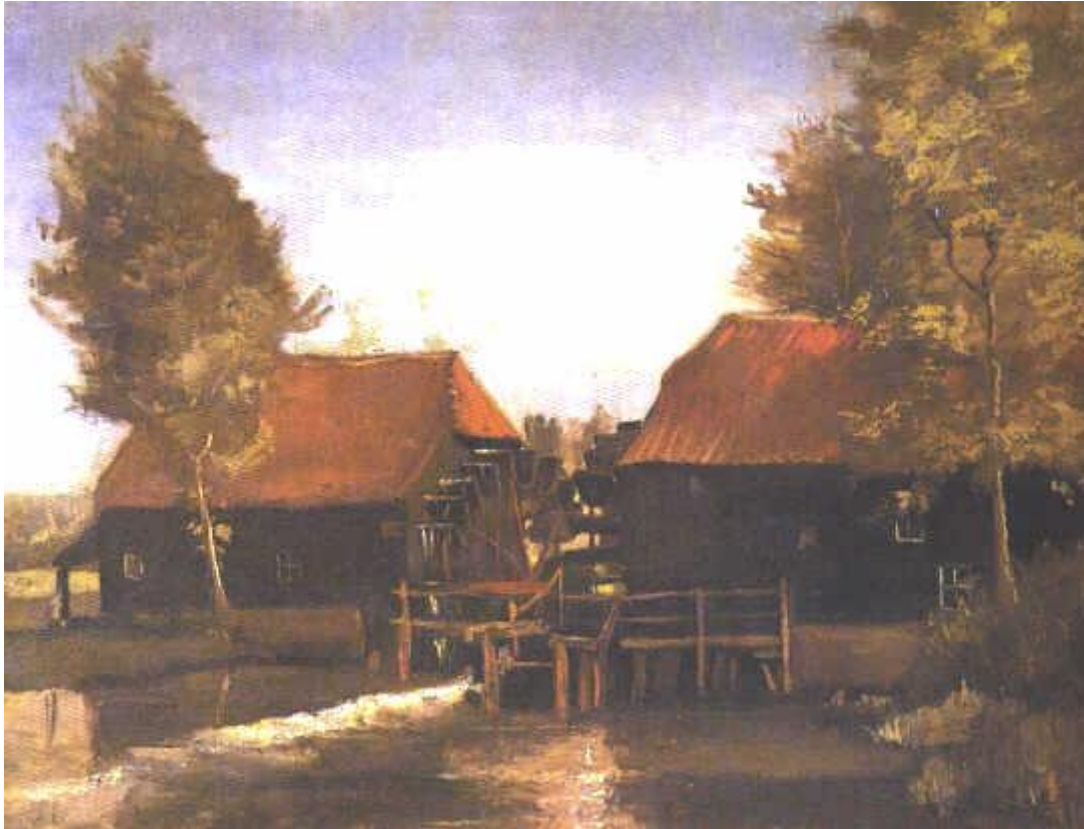
Peinture de Van Gogh, 1884. ©

En 1884 Vincent van Gogh a peint le moulin à eau.